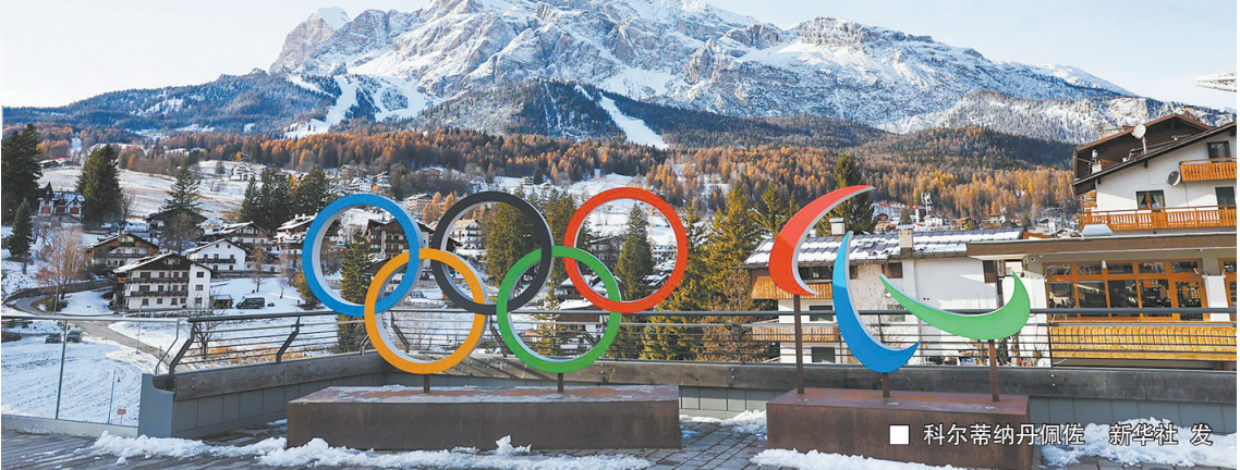
■ 科尔蒂纳丹佩佐

在米兰中央车站，巨幅吉祥物海报迎接着八方来客；地铁站内，吉祥物白鼬姐弟蒂娜和米罗的形象无处不在；大教堂旁的倒计时装置每秒跳动，都在累积这座城市的期待…… 当冬奥的时钟指向2026，冰雪舞台首次以如此舒展的姿态铺陈——从米兰的都市灯火到科尔蒂纳丹佩佐的雪峰剪影，再延伸至瓦尔泰利纳与费耶美山谷的壮阔雪场，这场冰雪盛会不再固守一城一地的传统格局，而是以“多中心联动”的全新模式，在意大利北部2.2万平方公里的广袤土地上，奏响一曲前所未有的“城与山”交响。