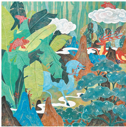
■ 马踏古尘映新晖 吴珂