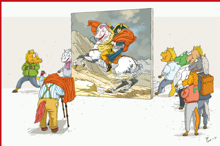
■ 高光时刻 刘可