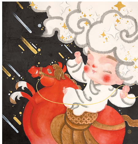
■ 马到成功 刘燕