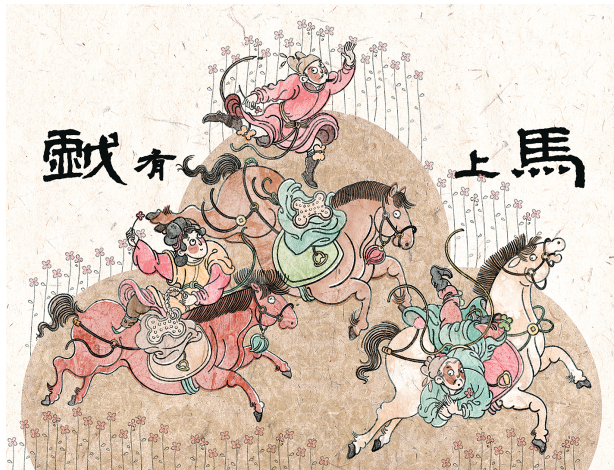
■ 马上有戏 孙烁楠