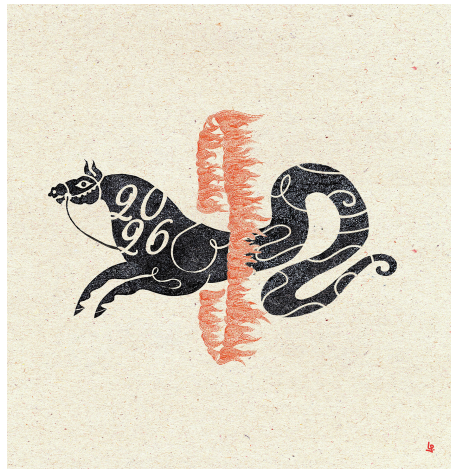
■ 蜕末骐始 乐观