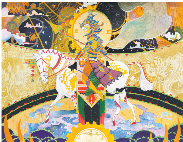
■ “骑”迹幻想 周子琳