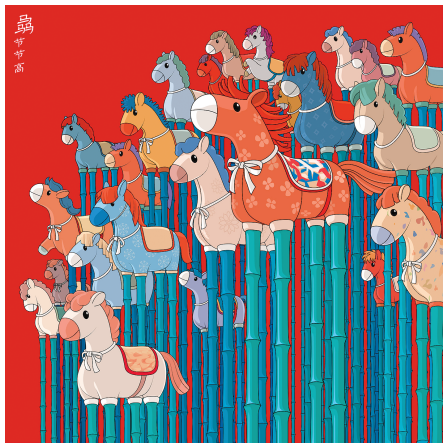
■ 马·节节高 黄艳华