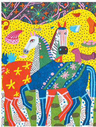
■ 星野里的彩马狂想 姜梅洁