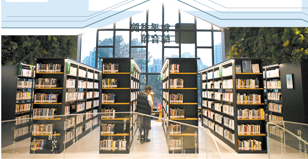
和平书院是小宣的“宝藏图书馆”