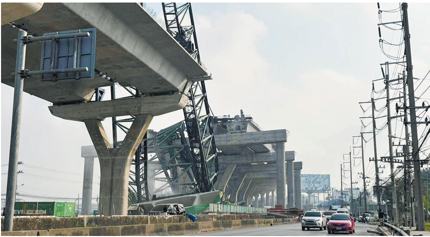
施工起重机倒塌事故现场

14日上午,一台起重机在呵叻府高铁项目施工过程中坠落,砸中一列行驶中的客运列车,导致车厢起火并脱轨,造成32人死亡、66人受伤。15日早,连接首都曼谷与沙没沙空府的拉玛2路发生施工起重机倒塌事故,造成至少2人死亡、多人受伤。