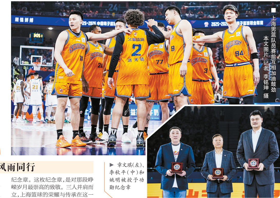
■上海男篮队员赛前互相加油鼓劲

2025年2月，年轻教练卢伟率队夺得首届CBA俱乐部杯冠军，让上海男篮成为第一个包揽联赛、杯赛双冠军的球队，续写着新的传承和传奇。昨晚，老队长章文琪手持一枚镌刻着2001—2002赛季夺冠阵容全体成员签名的纪念篮球，郑重地交到现任队长王哲林手中。这不仅仅是一件穿越时空的信物，更是将“顽强拼搏、追求卓越”的大鲨鱼精神密码，传递到新一代运动员的手中。 站在三十周年的新起点，上海男篮上下都对未来充满期待，李秋平说自己很欣喜看到传承的延续：“现在久事梯队的所有教练，包括卢