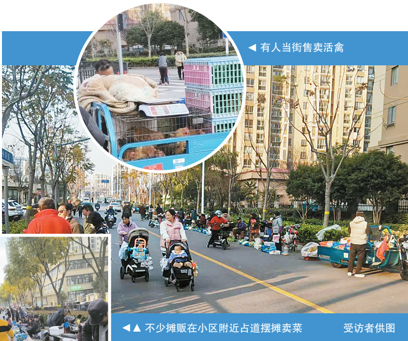
有人当街售卖活禽