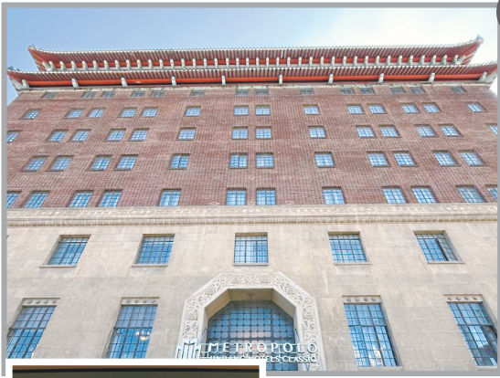
◀ 八仙桥青年会大楼