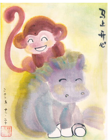
马上开心 (插画) PP殿下