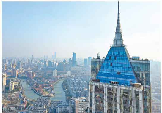
在环球港52层观光平台,市民可以体验从258米高处俯瞰浦西天际线的感觉