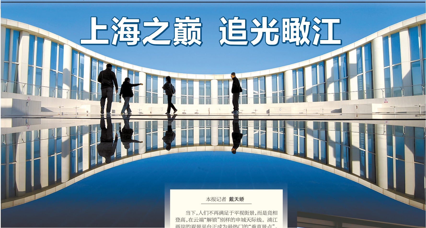
太平洋新天地258米观景平台犹如天空之境,随手一拍就是“大片”