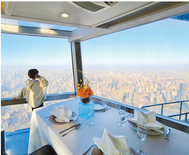
在悬浮于上海中心大厦121层的半透明玻璃空间“天空·魔盒”里,市民游客可以享用云端盛宴