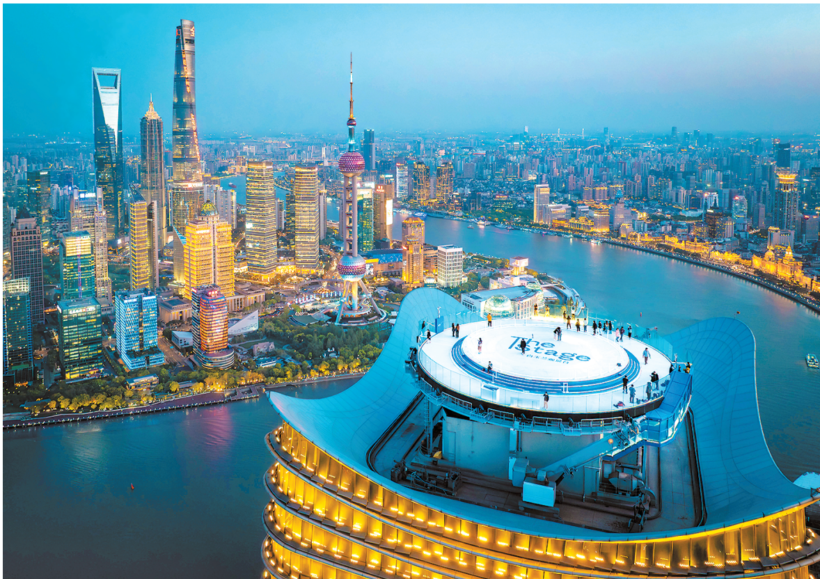
在Stage白玉兰观景台,游客可在320米高空欣赏浦江两岸景致