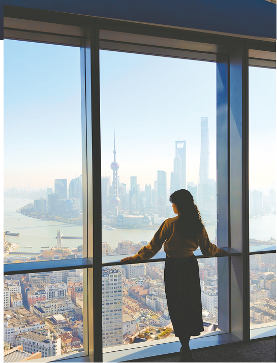
静安区苏河湾中心42楼,从落地窗望出去,浦江天际线和陆家嘴尽收眼底