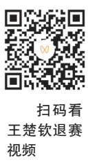
扫码看 王楚钦退赛 视频