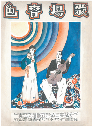
■天一公司电影《歌场春色》特刊(一九三一年)