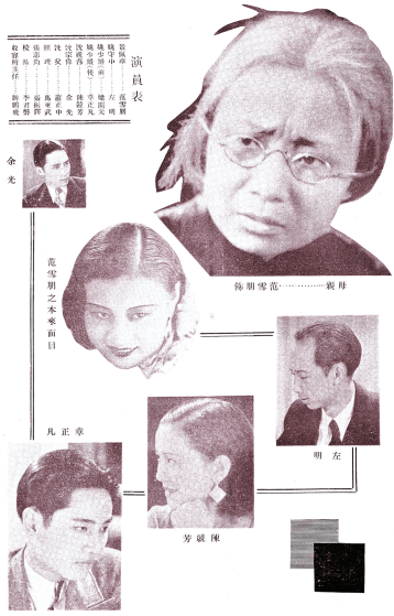
■强华影片公司电影《母亲》(1935年)演员照

120年前,谭鑫培的《定军山》片段定格了中国电影的原点。从北京丰泰照相馆的镜头,到上海礼查饭店的西洋影戏,再到20世纪20年代国产特刊的纸页留香,“到上海去”不仅是影史的地理迁徙,更是一部视觉艺术从外来试验,蜕变为民族文化产业的壮阔历程。