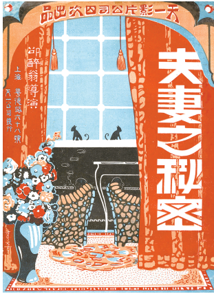
■天一公司电影《夫妻之秘密》海报(一九二六年)

11月21日,我受邀观礼上海电影博物馆“到上海去——纪念中国电影诞生120周年特展”开幕仪式。开幕式的设计独具匠心:谭门第七代嫡传后人谭正岩登台演绎《定军山》,以此拉开序幕。这一幕象征着中国电影的发端——1905年,北京丰泰照相馆主人任庆泰(字景丰),用一台舶来的二手电影摄影机,记录下京剧名伶谭鑫培的《定军山》片段。特展主标题“到上海去”,则勾勒出中国电影史上以上海为核心的辉煌篇章。在过去的120年间,这座城市见证了“影戏”(电影旧称)从一场个人主导的视觉器械试验,蜕变为一门震撼人心的现代文化产业。诚如所言:“其始也简,其毕也巨。”