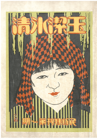
■民新公司电影《玉洁冰清》特刊(一九二六年)