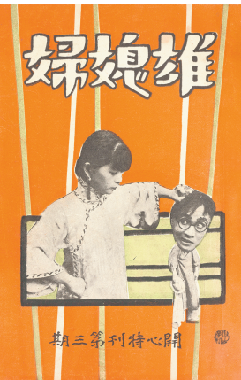
■开心影业公司电影《英雄嫂》特刊(一九二六年)

还刊载了上海影戏公司《小公子》《邻家女》等其他影片的剧照,以及公司主创人员的照片。