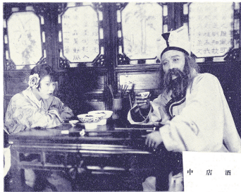
■长城画片公司《黄天霸招亲》(1928年)剧照

除《字林西报》外,《新闻报》于6月11日、13日分上下篇刊发《味菴园观影戏记》,详细