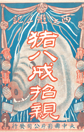
■大中国影片公司《猪八戒招亲》海报(一九二六年)