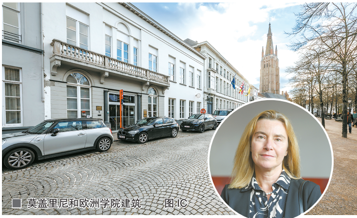
■ 莫盖里尼和欧洲学院建筑

欧洲检察官办公室的调查重点是名为“欧盟外交学院”的项目。这是面向欧盟年轻外交官的培训项目,首个“试验班”为期9个月。2021年至2022年,欧盟对外行动署经过公开招标,选定欧洲学院承接该项目。然而据欧洲