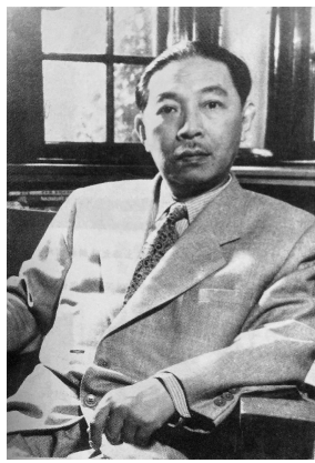
▲二十世纪五十年代文化部长任职期间

茅盾原名沈德鸿,字雁冰,1896年7月4日出生在浙江桐乡乌镇的一个普通人家。父亲中过秀才,病于家中;母亲出身于中医世家,主持家务。茅盾还有一个小他四岁的弟弟沈泽民。茅盾十岁时,父亲病故。他中学时代,辗转在嘉兴、湖州、杭州以及北京求学。1916年夏,从北京大学预科毕业,通过亲戚卢学溥表叔的介绍,到上海商务印书馆工作。 茅盾的择业与她母亲有关,茅盾母亲陈爱珠是一位很有主见的家庭妇女。在茅盾父亲过世后,她将家里的存款分成两半,一半供茅盾读书生活用,另一半留着培养茅盾的弟弟沈泽民。她省吃俭用,送两个孩子上学。茅盾从学校毕业后,进了商务印书馆,而弟弟沈泽民,1917年夏考取了南京的河海工程专门学校,与张闻天同学,他们俩志同道合,后加入了中国共产党,成为早期职业革命家。 茅盾到商务印书馆的第一项工作,是翻译出版了英语通俗读本《衣》《食》《住》,与老编辑孙毓修合作编选了《中国寓言初编》。1917年,茅盾在商务印书馆的《学生杂志》12月号上发表了《学生与社会》,这是他发表的第一篇论文。同年,他在《学生杂志》