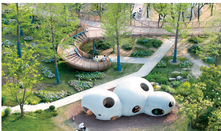
▲ 西岸自然艺术公园的绿道和社交场所