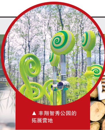
▲ 丰翔智秀公园的拓展营地