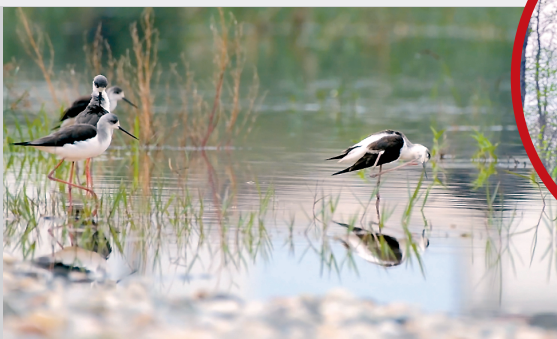
▲ 金海湿地公园的野生动物