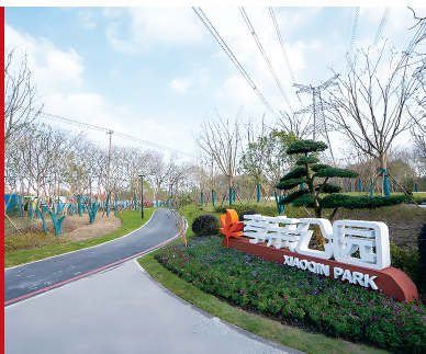
▲ 上海高东镇的孝亲公园