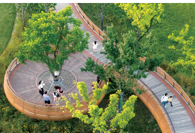
▲ 西岸自然艺术公园多维绿道鸟瞰图