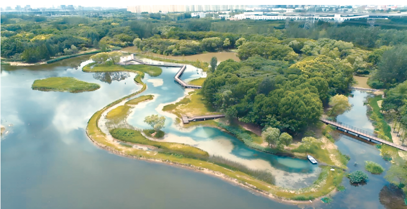
▲ 空中俯瞰金海湿地公园

“走在木栈桥上,脚下是清澈湖水,头顶是飞鸟,身旁是大片森林,仿佛踏进宫崎骏的动画世界!”这是公园发烧友踏入位于浦东的金海湿地公园的实测感受。从星罗棋布的废弃鱼塘到候鸟栖居的“生态魔方”,金海湿地公园的蝶变中藏着城市与自然共生的设计智慧。