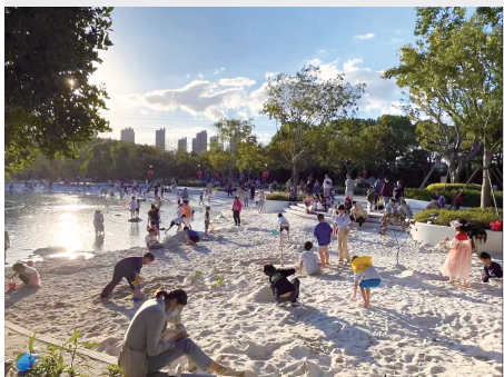
▲ 金海湿地公园的白沙滩