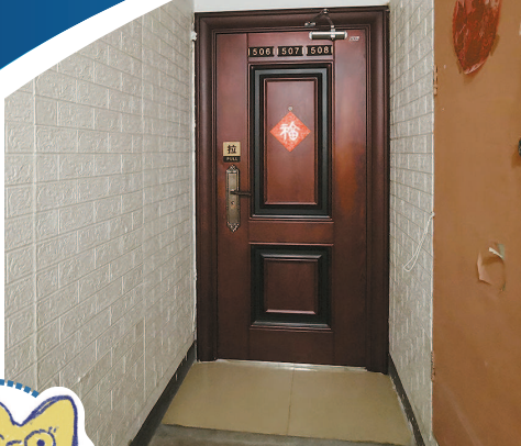
(大图),还有人直接加锁(小图) 多处防火隔离门被改造,有人加了一道金属镂空门