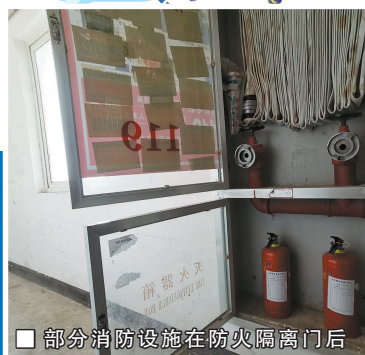
部分消防设施在防火隔离门后