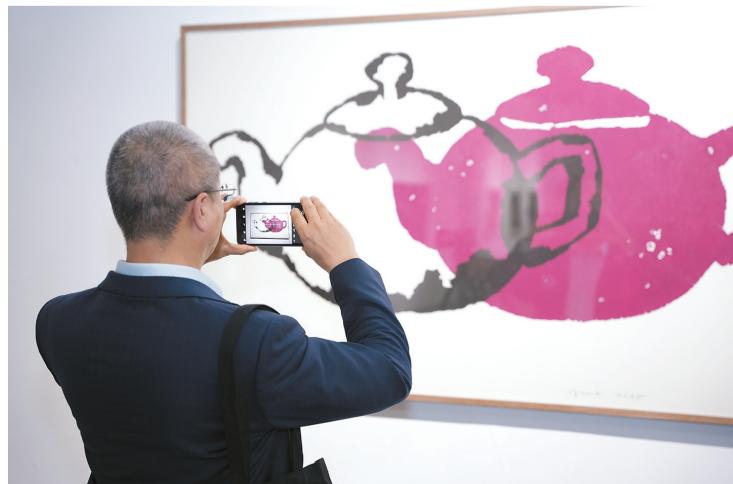
苏新平作品《茶壶与它的影子》