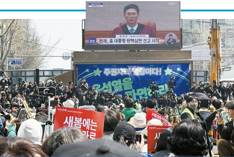
首尔民众在韩国宪法法院附近观看总统弹劾案宣判电视直播

历经111天,韩国总统弹劾案今天终见分晓。韩国宪法法院4日宣判罢免尹锡悦的总统职务,这不仅将对韩国内政产生深远影响,也将在一定程度上影响东北亚地区形势。