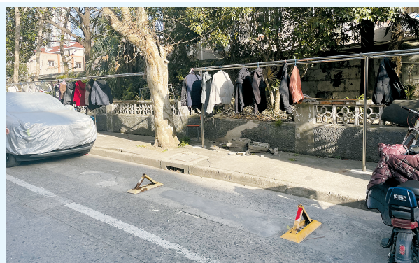
不少人在地上擅自安装了地锁