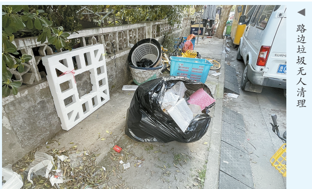
路边垃圾无人清理