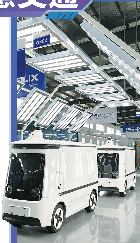
■ 新石器无人车(松阳)有限责任公司无人驾驶物流车生产线

拥有1800年建县史的松阳，正凭借深厚的历史文化底蕴，积极拥抱智慧时代浪潮。在智慧交通产业发展的道路上，松阳诚意满满、潜力无限，诚邀各方有志之士共赴这场充满机遇的发展之约。