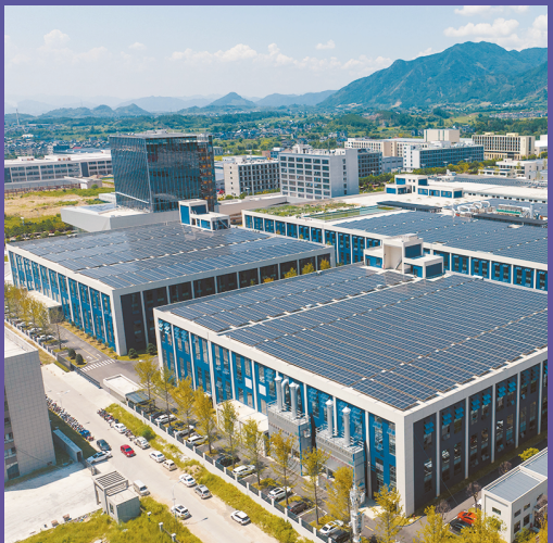
■ 松阳智慧交通产业园