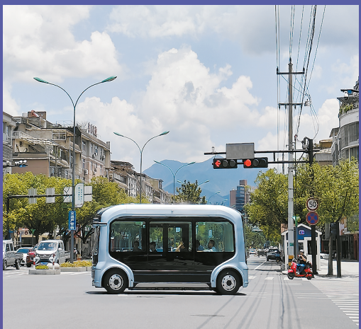
■ 文远知行无人驾驶公交车行驶在松阳街头