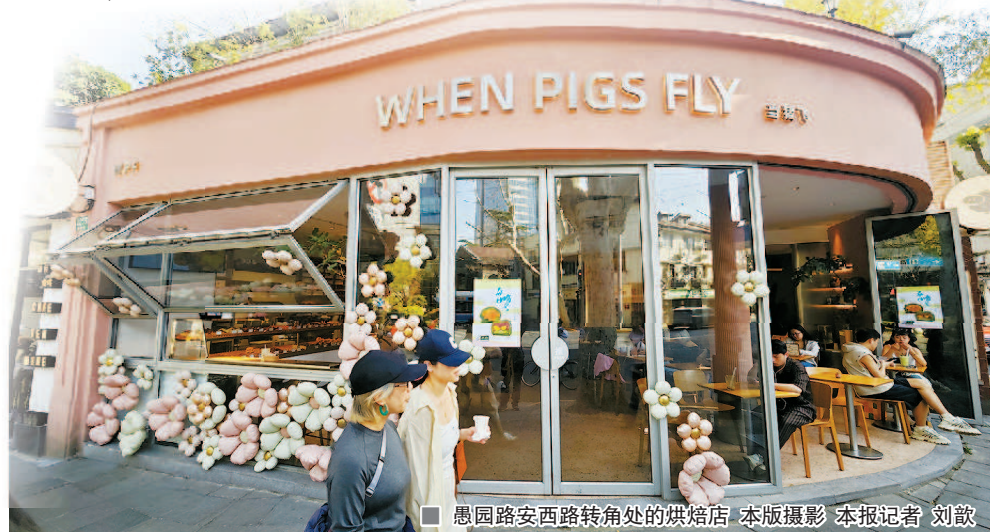
愚园路安西路转角处的烘焙店

“未来，街区将深耕在地文化，融入新兴生活方式，营造惬意生活氛围，通过打造多元商业场景，持续满足个性化的消费新需求。”许引兰说。