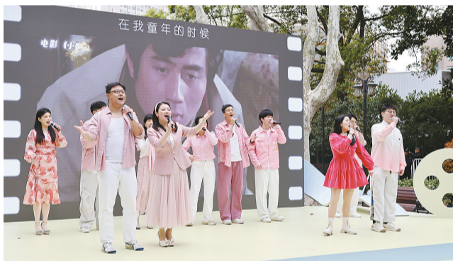
阿卡贝拉演唱《光影留声机》

这条城市走读线路,可以从复兴西路出发,柯灵旧居中藏着柯灵、上官云珠的故事,玫瑰别墅里观众可以探寻金焰秦怡夫妇、徐玉兰、张骏祥的往昔。经过武康大楼前往武康路391弄1号,回味周璇的故事,随后依次