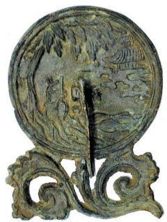
宋·月宫镜,上海博物馆藏

除了手持之外,将铜镜放置于金属、木质或其他材质的镜架、镜台上,也是铜镜使用的常见方式。中国古代镜架的产生大约是在战国晚期,最早的是2002年湖北枣阳九连墩战国中期楚墓中出土的漆木梳妆盒中的镜架。敦煌61窟两幅壁画中有类似的三足镜架,虽然壁画中铜镜是正面悬挂在三足镜架上,无法知晓铜镜的具体悬挂方式,但它足以证明当时存在三足支架式