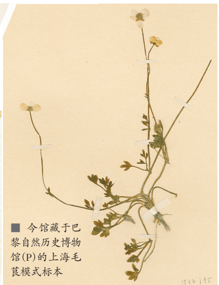
■ 今馆藏于巴黎自然历史博物馆(P)的上海毛茛模式标本