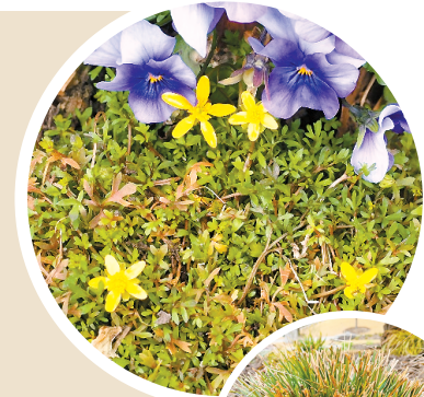
▲ 闵行体育公园的上海毛茛