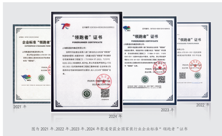
图为2021年、2022年、2023年、2024年聚通荣获全国家装行业企业标准“领跑者”证书

3月上旬,中国建筑装饰协会正式发布2024年度家装企业标准“领跑者”名单。凭借高品质交付实力和全方位服务能力,聚通再度登榜,四度蝉联该称号。标杆看领跑,装修选领跑。聚通作为上海家装行业龙头企业,在保障自身交付品质的基础上,持续推进行业规范发展。