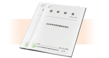
图为上海消保委发布的《住宅装饰装修质量验收规范》,聚通受邀参与编制该标准

班标准工艺、118道质量验收节点,同时参与编制《住宅装饰装修质量验收规范》团体标准,让施工更严谨、验收标准更规范。