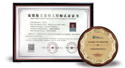
图为聚通被授予“全国家装交付工程师培育基地”(右)、聚通工匠荣获“家装施工交付工程师认证证书”(左)

“家装施工交付工程师”由国家人力资源和社会保障部核准,全国工商联人才交流中心颁发的职业岗位职称,培育基地有能力进行该岗位技术人员的培养工作。