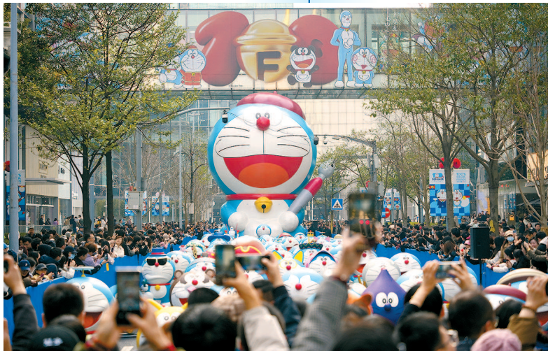
■十二米高的巨型哆啦A梦和它的雕塑团队齐聚亮相,吸引无数粉丝打卡

开放的免费展区覆盖至安义路和静安嘉里中心一楼中庭,包括哆啦A梦与亲友盛装造型组成的“100%哆啦A梦安义路蓝毯”“100%哆啦A梦巨型漫画区”大型装置等,IP形象成群结队“走”进现实世界;付费展区呈现多重为上海站特别设计的惊喜。82个1比1哆啦A梦雕塑呈现哆啦A梦电影经典造型及创意设计,为大陆站添加新元素的原创动画“胖虎世界巡回演唱会”也将首度放映。