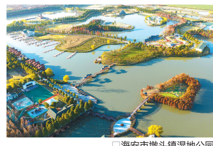
海安市墩头镇湿地公园