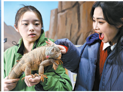
南通森林野生动物园游客与动物互动