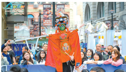
在南京路举行的“江海有情 南通有请”2024文旅推介会