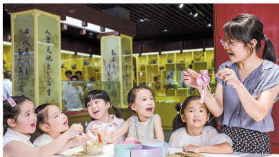
小朋友在南通中医药文化博物馆学习制作香囊