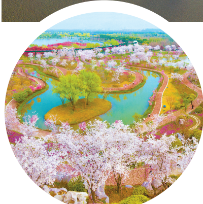
南通洲际梦岛岛