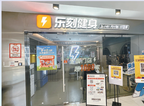
乐刻健身在招牌上十分醒目地打出“24小时,月付制”口号

3月1日起,《上海市体育健身行业预付式消费经营活动监管实施办法(试行)》(以下简称《办法》)正式施行,首次设定了“三限”的核心条款,即预收资金限额、限期、限次标准。最严“新规”落地后,执行情况如何?连续两天,记者走访调查了沪上30多家健身机构,发现大多数均能遵守规定,但仍有个别存在超限卖课行为。