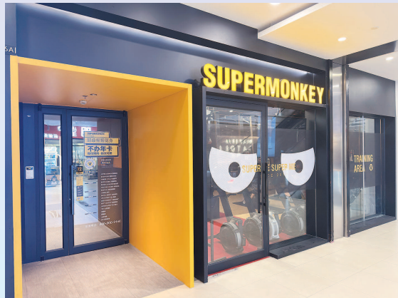
超级猩猩健身馆“不办年卡”,让消费者健身消费时无压力