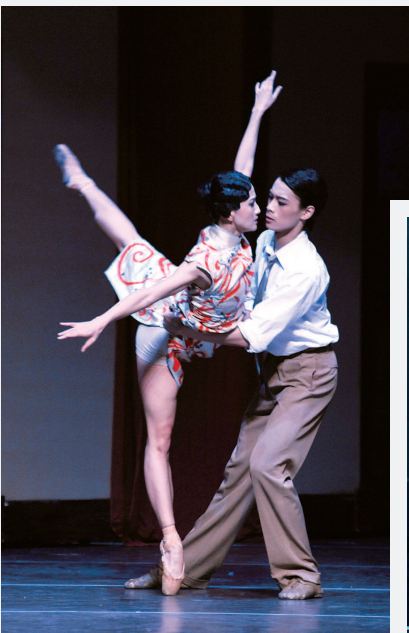
上海芭蕾舞团《花样年华》剧照