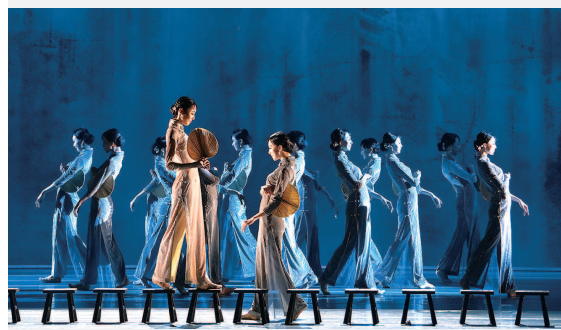
舞剧《永不消逝的电波》剧照