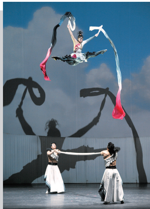
上海杂技团《雕刻时光》剧照