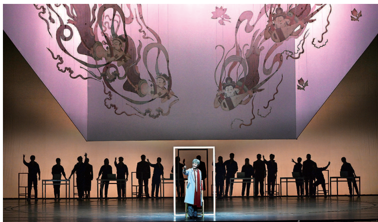
沪剧《敦煌女儿》剧照

当数字技术不断解构艺术形态之时,祖忠人用镜头构筑的记忆共同体,恰似一剂温暖的文化清醒剂——提醒我们:真正的艺术永恒性,在于对人性深度的勘探与时代精神的精准捕捉。