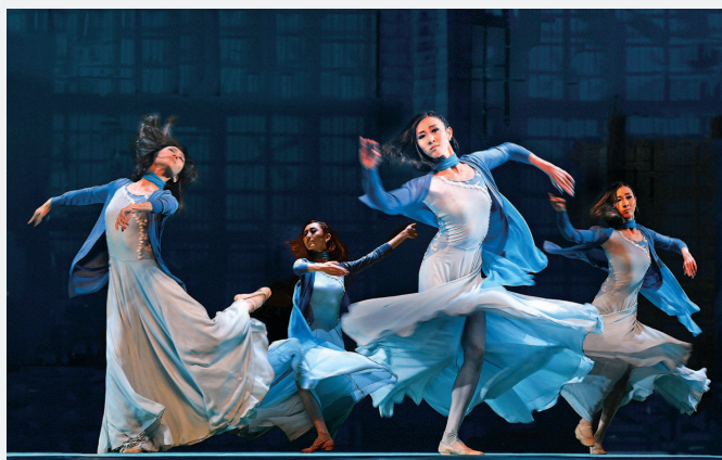
舞剧《一起跳舞吧》剧照