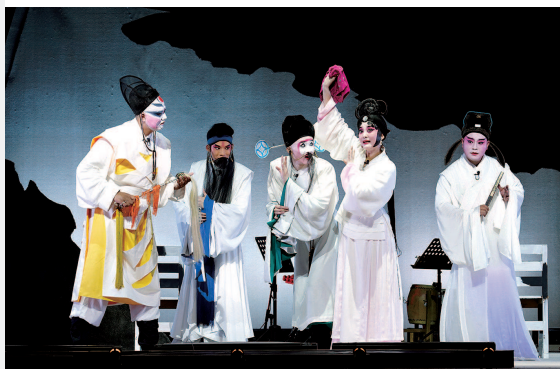
淮剧小戏《画中画》剧照