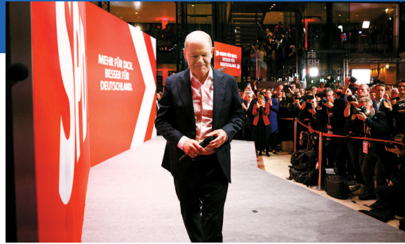
▲ 德国总理朔尔茨在大选失利后走下讲台 ▲ 默茨(中)获胜后接受祝贺