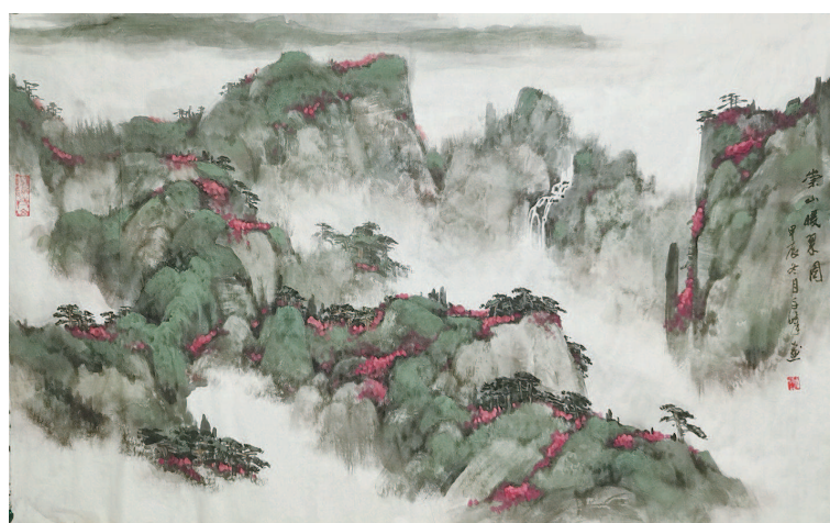
崇山暖翠 (国画) 武千嶂

编者按:《哪吒2》登顶中国影史票房榜单。历经百年沧桑的中国动画行业,从不缺乏亮眼的作品。我们这次邀请了动画行业的从业者、影视行业的专家教授和普通观众一起聊聊他们心目中最爱的国产动画。