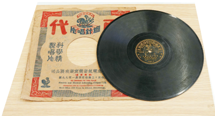
▲ 光曲《黑胶唱片》 ▲ 一九三四年版《渔光曲》

革命文物一字排开，展台前人潮涌动。昨天，“载获济济——中共一大纪念馆2024年新征集文物藏品成果展示会”在中共一大纪念馆报告厅举行。记者获悉，2024年，中共一大纪念馆共征集到近400件/套、近1000件藏品。其中，208件/套重要藏品亮相成果展示会，多为珍贵文物。