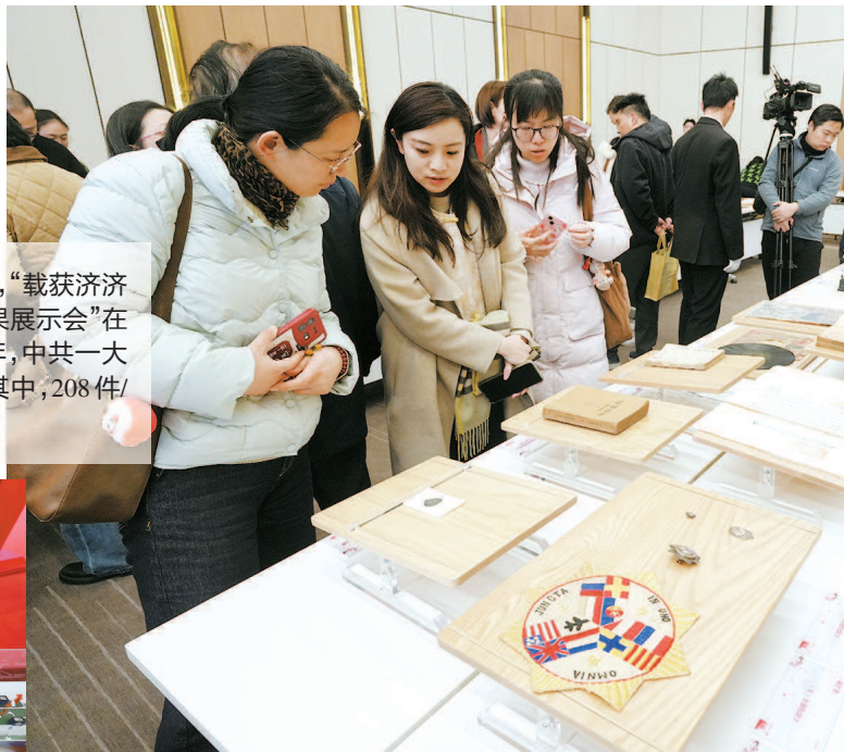
▲ 中共一大纪念馆2024年新征集文物藏品成果展示会现场人头攒动 ▲ 董必武使用过的手杖和电风扇 本版摄影 本报记者 刘歆

革命文物一字排开，展台前人潮涌动。昨天，“载获济济——中共一大纪念馆2024年新征集文物藏品成果展示会”在中共一大纪念馆报告厅举行。记者获悉，2024年，中共一大纪念馆共征集到近400件/套、近1000件藏品。其中，208件/套重要藏品亮相成果展示会，多为珍贵文物。