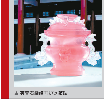
▲ 芙蓉石蟠耳炉冰箱贴