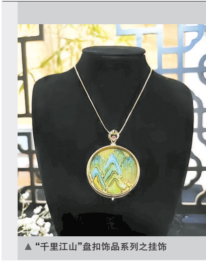
▲ “千里江山”盘扣饰品系列之挂饰