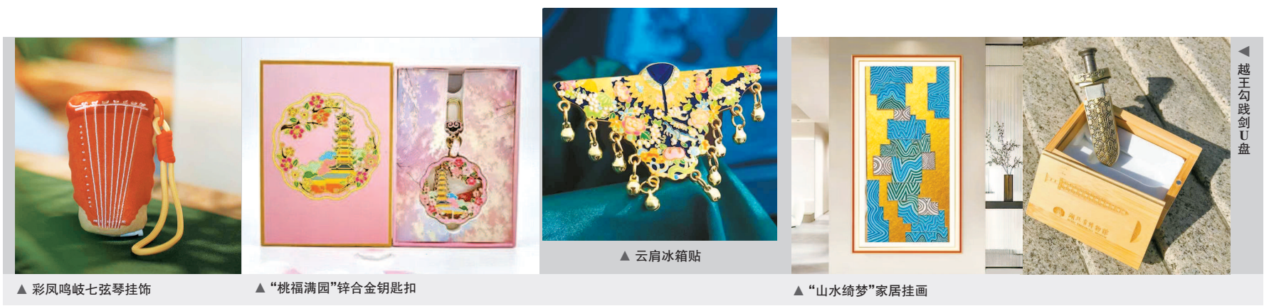
▲ 彩凤鸣岐七弦琴挂饰