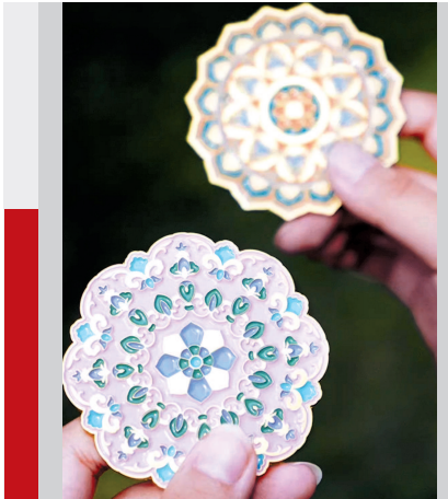
▲ 甘肃省博物馆的敦煌藻井系列随身镜