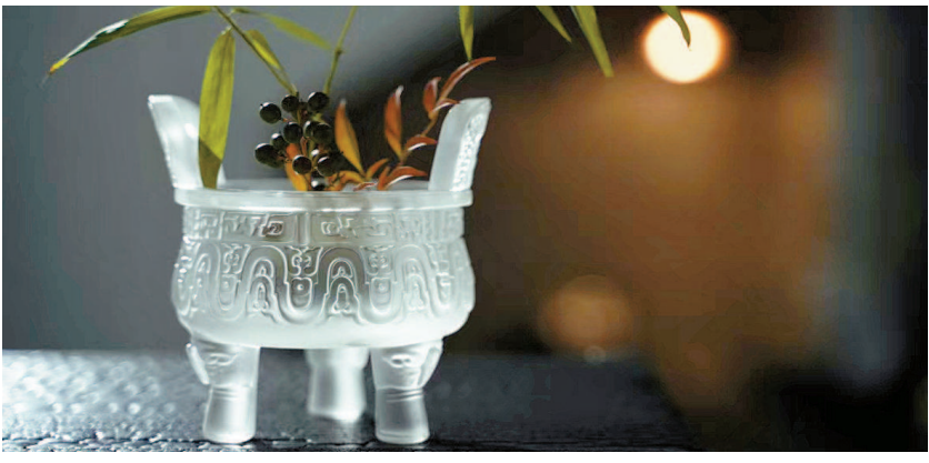
▲ 上海博物馆的大克鼎琉璃纪念版