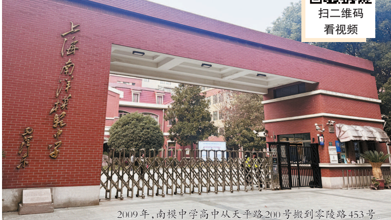
2009年,南模中学高中从天平路200号搬到零陵路453号。