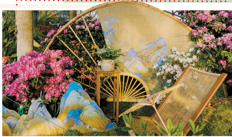
▲ 杜鹃报春 ▶ 山茶摇曳 ▼ 牡丹竞放