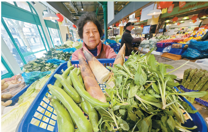
■ 乌中市集的蔬菜摊位，春笋、蚕豆、马兰头等鲜嫩水灵