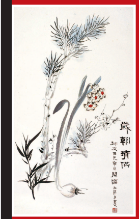
图四《岁朝清供》张大千