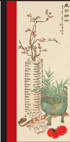
图一《岁朝图》赵叔孺