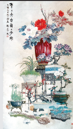
图一《岁朝图》孔小瑜