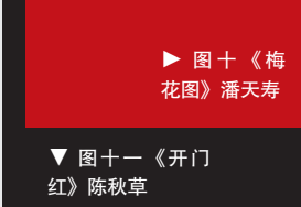
图十《梅花图》潘天寿