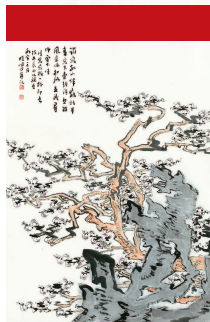
图七《梅花图》陆俨少