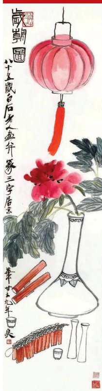
图六《岁朝图》齐白石