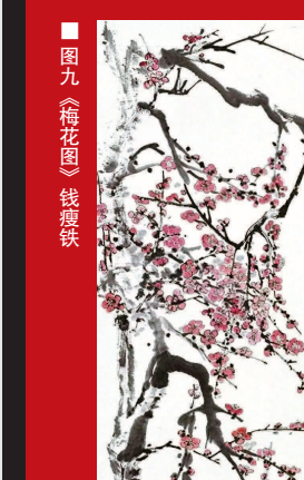
图九《梅花图》钱瘦铁