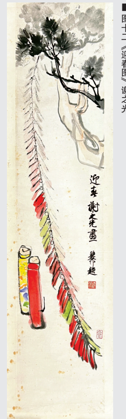
图十二《迎春图》谢之光