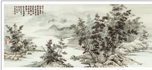
川上行 (中国画) 林伟光

身,隐没在烟尘之中,我们至今没有明确的答案。一定不是因为天赋不够,关紫兰是最早一批受到野兽派影响的画家,但她并不是一味模仿,她把野兽派的狂放吸收进了自己的闺房,她的笔触下透露出一种独有的端庄、明媚和爽朗。当时人称她是“远处的一盏明灯”。但这盏灯,选择了照亮自己,而不是照亮世界。 她默默做了很多事情。老师陈抱一的房子被烧毁之后,她资助了老师全家,陈抱一因为娶了日本太太而备受指责,也是关紫兰伸出了援助之手。上海沦陷之后,拥有留日经历的关紫兰收到了日本人的邀请,她选择了拒绝。 我比较过她和潘玉良画的菊花,她的菊花是生动明亮的,但潘玉良的菊花显然有更多的故事。潘玉良的菊花是耐人寻味的,关紫兰的却是积极美好的。潘玉良想要诉说,关紫兰则选择了无言,因为她什么也不需要说,她非常自洽。