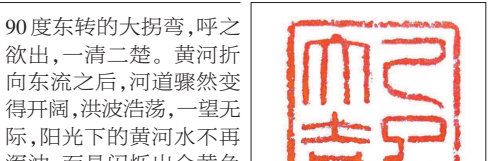
乙巳大吉 (篆刻) 杨靖

把亲情作馅,揉进的是和熙;把友情作馅,揉进的是义气;把爱情作馅,揉进的是甜蜜。三百六十五个日子,在这一刻,都躲了进去。甜的是历史,咸的乃往事,各种滋味,全部煮成了悲与喜。即使有多少纠结,谁也算不出它的圆周率。此刻,咬一口,也嚼不碎它的所有秘密。毕竟,这团圆,捏成了永恒的主题。