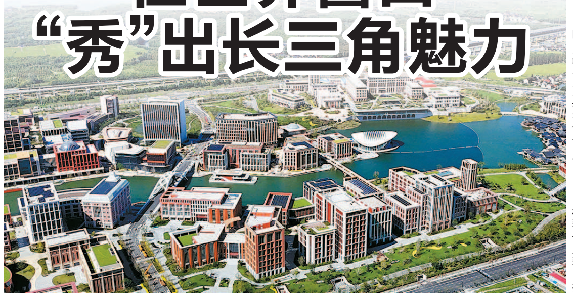
■ 鸟瞰华为练秋湖研发中心

伴随长三角高铁网络越织越密,沪苏浙皖“人来人往”愈发便捷。在刚过去的上海两会,长三角文旅消费联动,成为代表委员的热议话题,也让即将到来的蛇年新春,愈发令人期待。