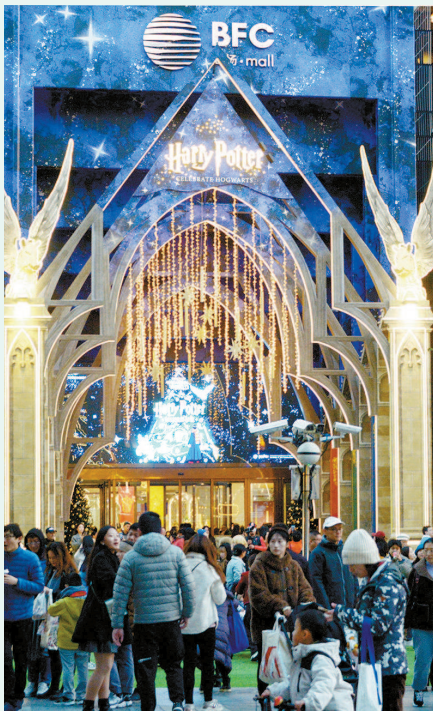
■ 哈利·波特主题魔法奇境亮相BFC外滩金融中心

China Travel也给区域联动进一步释放利好消息,长三角文商旅体展融合,延长消费链条。例如,就近期“韩潮”涌动,代表委员建议上海联动周边区域推出更多跨区域产品:“例如,不仅有上海大韩民国临时政府旧址,上海周边嘉兴、杭州等城市也有类似的纪念地,旅游机构能否推出跨区域的旅游产品,又如上海博物馆、南京博物院、苏州博物馆等长三角区域知名博物馆的特展能否发行联票套票”……从“第一站”辐射,带动周边“第二站”“第三站”的接续,上海与苏浙皖地区互相赋能,长三角文旅一体化也将形成良性循环。