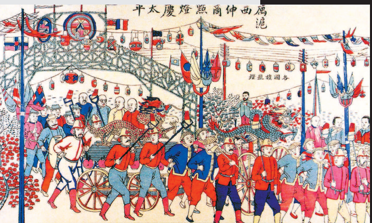
■ 小校场年画《寓沪西绅商点灯庆太平》

了从农耕文明进入城市文明的杂糅、嬗变及转型程序。小校场年画异军突起,成为中国年画创作生产中的新兴力量,并迅速形成独特的海派风格,推动中国传统木版年画进入最后一个高峰。