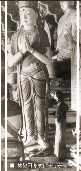
林徽因考察佛光寺东大殿

本次展览中最值得关注的展品，无疑是梁思成呕心沥血撰写、却遗憾未能在其生前付诸出版的遗稿——《营造法式》注释。2025年，适逢《营造法式》（陶本）刊行一百周年。这部由建筑学泰斗朱启钤与藏书大家陶湘校订并出版的中国建筑史开山巨著，经朱启钤赠送梁启超，又转赠于梁思成林徽因，成为开启梁林建筑史研究的学术原点。为了解读《营造法式》，梁林穷尽了一生。此外，1928年9月林徽因于上海写给梁启超的信，也首次公开展出，将为观众打开一窥这位非凡女性内心世界的