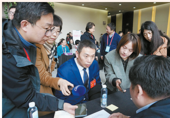
政协现场咨询活动气氛热烈

昨天11时30分许，市委党校海华教学楼1楼大厅内人声鼎沸，一年一度的委员现场咨询活动拉开帷幕，全市37家单位负责人现场“摆摊”，热情接待市政协委员的咨询和