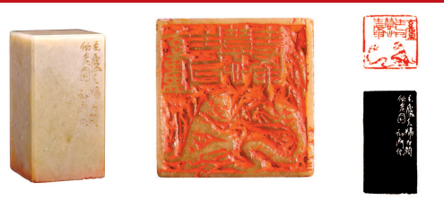
■ 肖形印 玄庐夫妇白头偕老图 来楚生刻