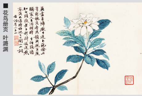
■ 花鸟册页 叶澐渊