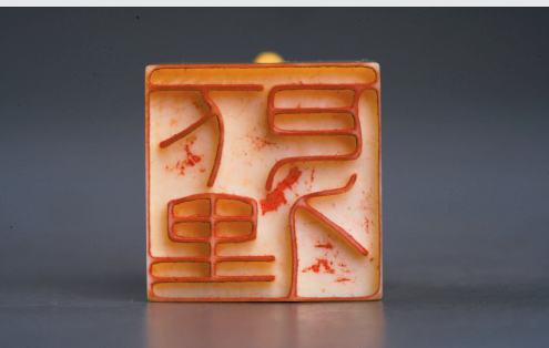
■ 朱文“下巴里人”牙章 2x2x2.9cm 陈巨来刻