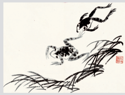
■ 来楚生花果草虫册 来楚生

近年来,随着金石学热度的不断升温,篆刻已然成为艺术领域极受关注的门类,收藏群体的年轻化,更彰显了篆刻艺术未来无限发展的可能性。继承传统,发展篆刻艺术,成为现在及将来艺术发展的一项课题。在这样艺术发展的大背景下,上海中国画院以强烈的历史使命感与社会责任,策划了“游刃乾坤——近现代海派篆刻的崛起暨来楚生、陈巨来、叶澐渊篆刻学术特展”,这是近现代海派篆刻第一次大规模集展,具有极高的学术价值。