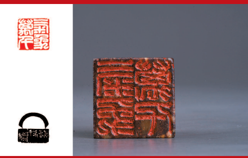
■ 白文“气象万千”印 2.9x2.9x2.8cm 叶澐渊刻