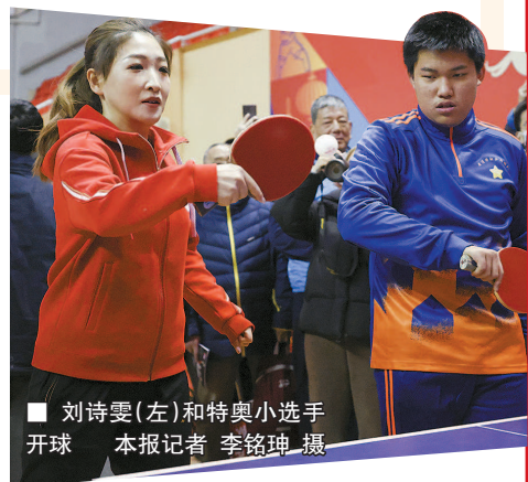
刘诗雯(左)和特奥小选手开球

热度与温度,让2025开年的这场乒乓盛宴,赚足了人气赢得了人心。快乐乒乓球,新民朋友圈,这份绵延20载的情谊也将在未来陪伴一代代乒乓爱好者成长,打造申城群众体育赛事的金字招牌。