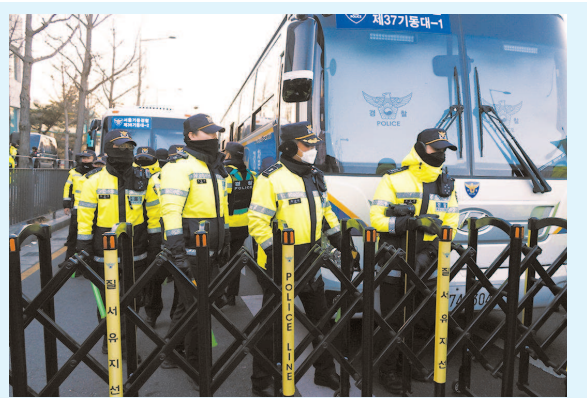
▲警察在总统官邸严阵以待