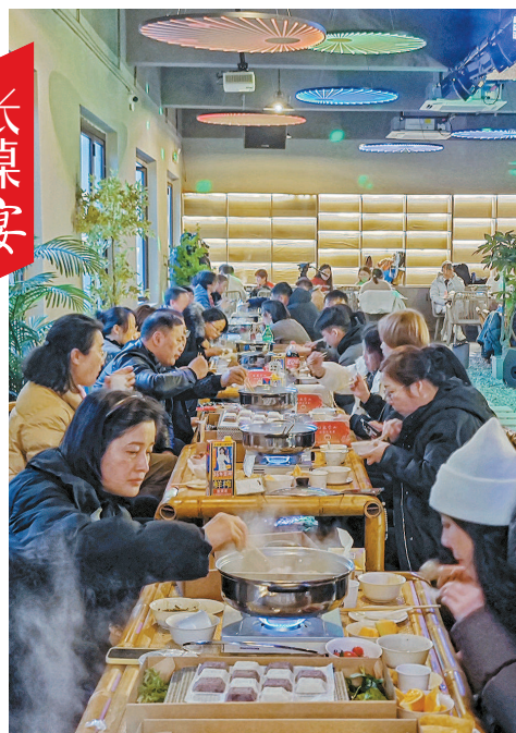
悠扬的歌声,热气腾腾的火锅……2024年最后一晚,新年的钟声即将敲响,一场别开生面的迎新宴“蛇年迎新”海鲜火锅长桌宴在金山区山阳镇金山嘴渔村开席。市民游客欢聚在一起,拉家常,尝美食,迎新年,感受沪上渔村海鲜大宴的独特魅力和浓浓年味。