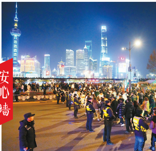
为有效应对广大市民游客观光游览形成的大客流,黄浦警方昨晚在南京路步行街、外滩区域投放了充足的安保力量。图为警察在路口站成一排活动的“墙”,引导大家安全有序地穿过马路