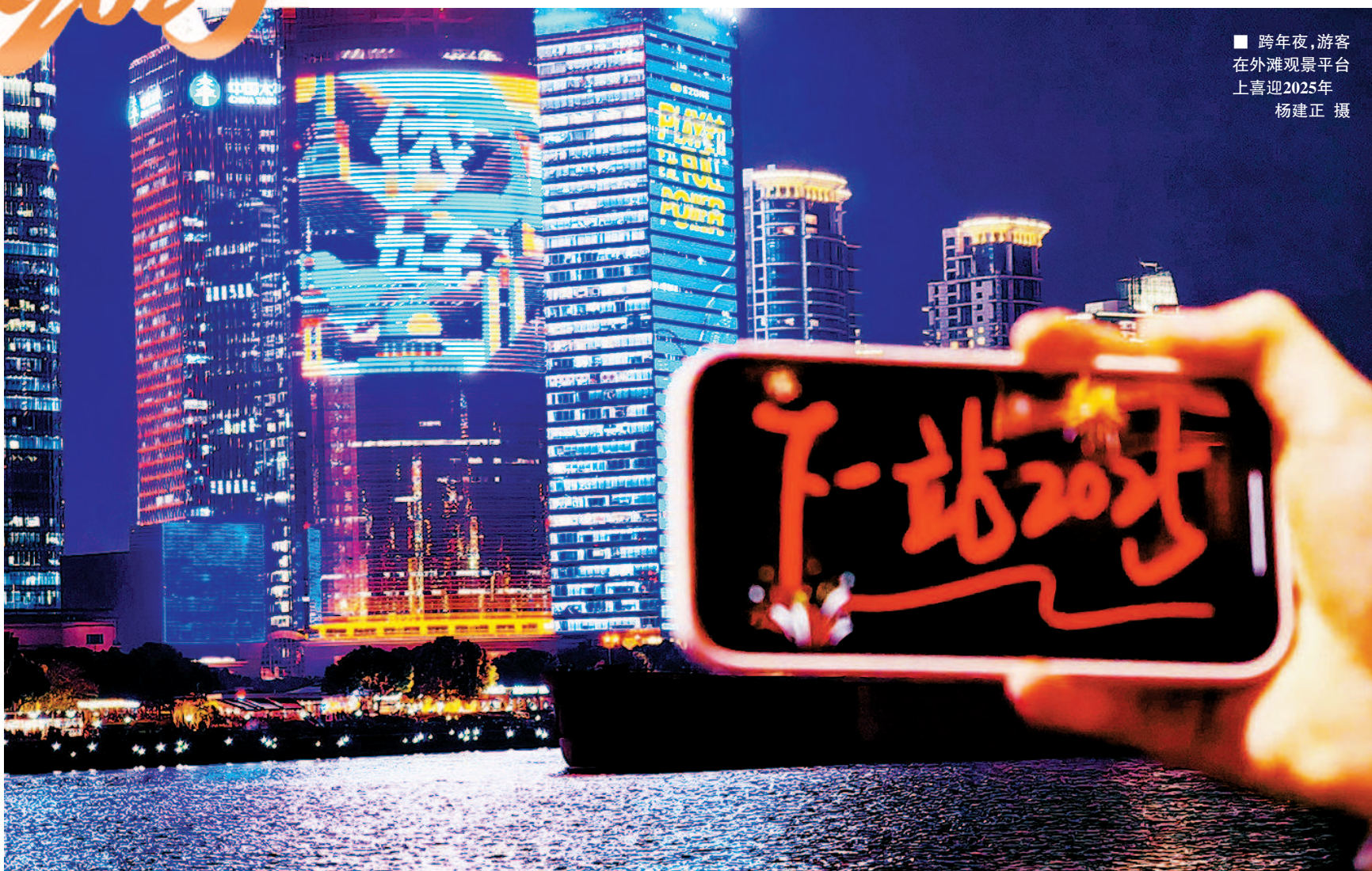
■ 跨年夜,游客 在外滩观景平台 上喜迎2025年