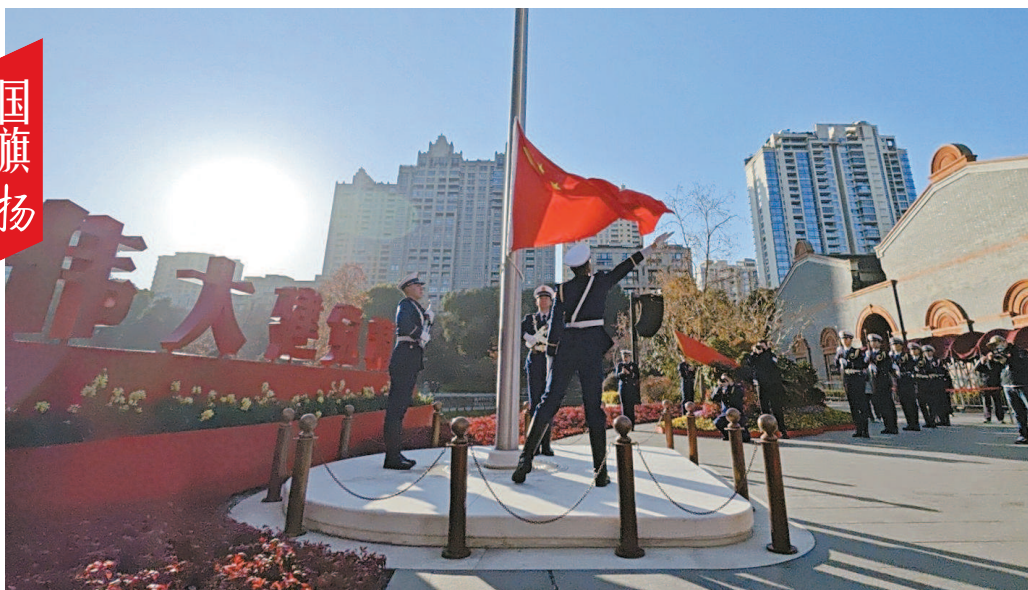
今天上午8时30分,迎着2025新年的曙光,中共一大纪念馆在一大广场举行神圣庄严的升旗仪式。图为鲜红的国旗冉冉升起,自发而来的群众集体观礼