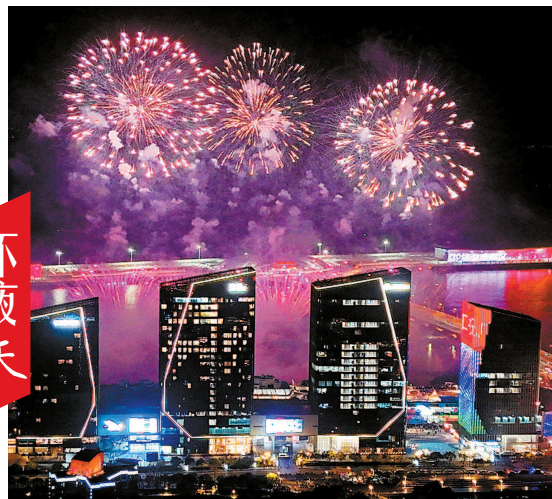
昨晚,位于宝山滨江地区的吴淞口国际邮轮港烟花绽放。“火树银花不夜天”——难得一见的璀璨美景让人目不暇接。