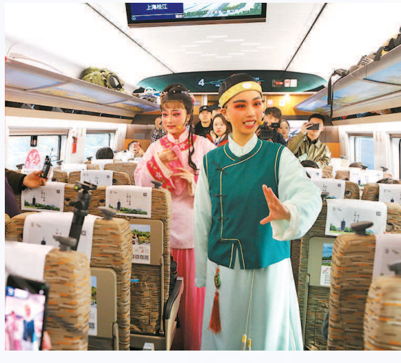
首发列车的车厢内，演员表演湖剧《过桥》