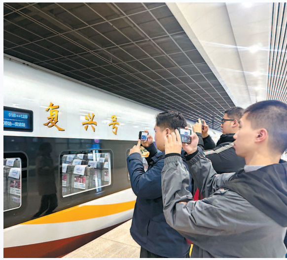
沪苏湖高铁通车，今天上午，高铁发烧友在上海虹桥站打卡