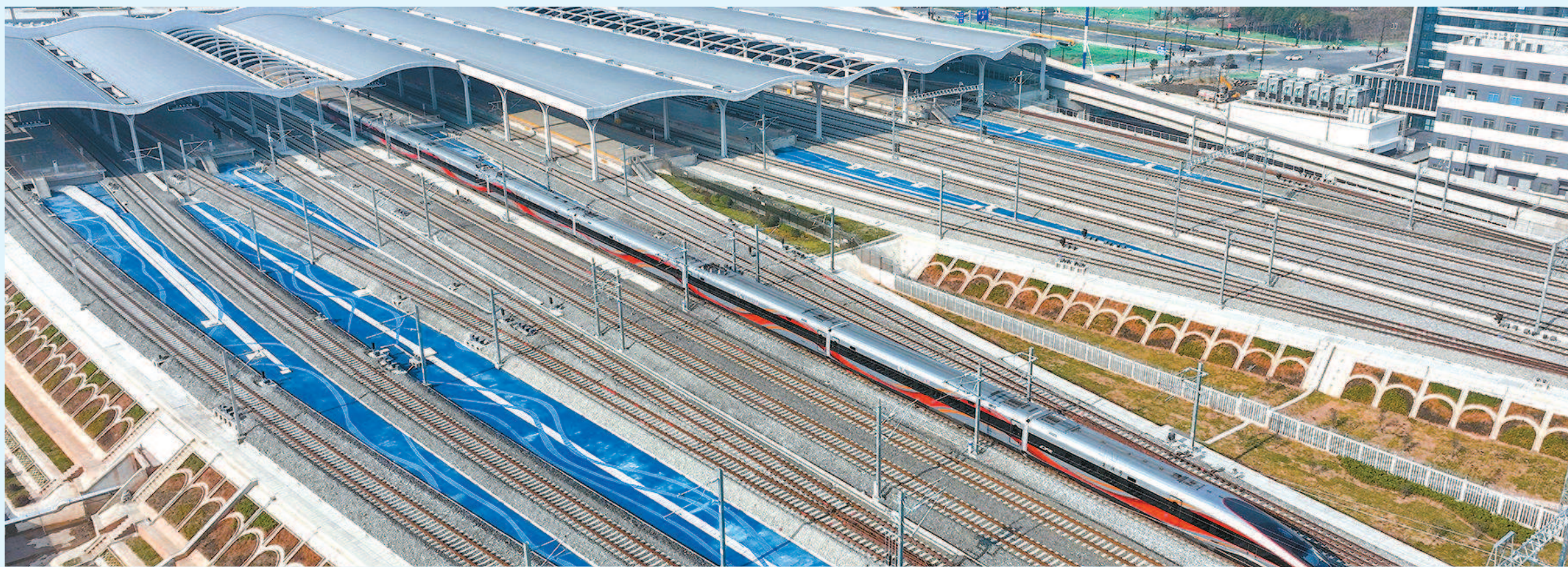
今天上午，沪苏湖高铁首发列车驶出上海松江站