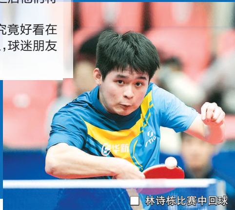
林诗栋比赛中回球