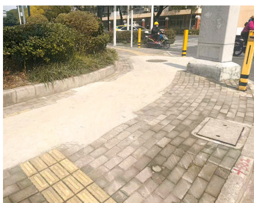
■ 人行道坑洼不平,打了不少“补丁”

区,老人小孩也比较多,人行道高低不平,一不小心就会绊倒摔跤,遇到下雨天,路面更是泥泞不堪,非常难走。居民们还提到,之前该路段周围的国年路、国顺路、国权路等都相继升级改造,车行道和人行道翻修后焕然一新,路面整整齐齐,既安全又美观。相比之下,这段政修路的路况实在糟糕,与周边环境格格不入。市民呼吁,希望政修路也能尽快完成翻修,让出行之路更加安全、干净、有序。