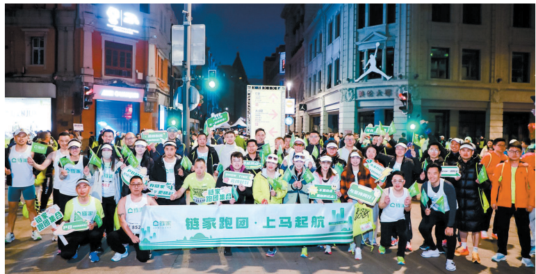
上海链家2024上马跑团集合现场

跑者提供了补给服务,不仅为跑者提供必要的支持,更以一种“家”的姿态,迎接每一位勇士。