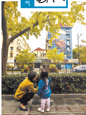
■ 深秋的申城,色叶树已渐渐变色。今晨的四平路上,银杏叶呈现出金灿灿的美景

本报讯(记者 马丹)受暖湿气流影响,昨夜今晨小雨报到。今天白天,上海都维持阴到多云有时有小雨的天气。暖气团也将最高气温带到18℃附近,可以说是近期最暖的一天。然而,这种“锋前增温”现象是冷空气到来之前的老“套路”。目前,寒潮级别的冷空气正在南下,早晨其前锋已到达北京、河北、河南一线,预计今天傍晚到上半夜抵达上海,冷暖气团发生激烈“冲撞”,雨势会有所增强,并可能出现雷电活动。与此同时,气温也将明显下降,风向转为西北风,阵风可达7~8级,沿江沿海地区可达8~9级,风寒效应明显,晚归的市民记得及时增添衣物。