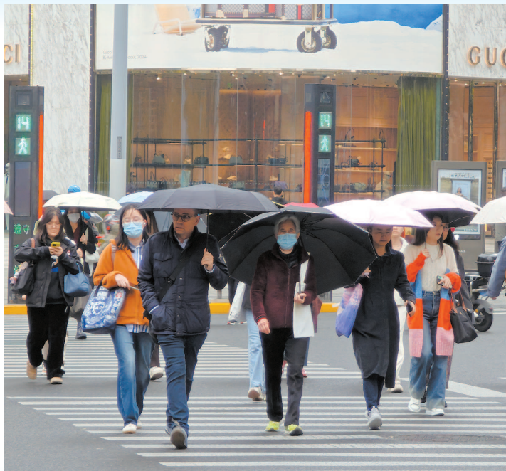
■ 寒潮将于今夜抵达申城,开启“过山车”式降温

雨水逐渐停止,本市天气逐步转为阴到多云。但是,在干冷气团的影响下,未来两天气温一路走低。明天阳光回归,最低气温预计从今天的14℃跌到8℃,最高气温也只有11℃,叠加强劲的西北风,晴冷体感上线。到了周三,气温会再下一个台阶,全天气温都在个位数,预计为4℃~9℃,让人限时体验冬的滋味。本轮寒潮影响下的最低气温预计将出现在周四早晨,届时市区的最低气温将跌到3℃,郊区更低,只有1℃左右。不过,周四白天起,冷空气影响趋于结束,气温会逐步回暖,重回两位数,本周后期到下周初的天气平稳,阳光持续在线,最高气温会回到14℃~15℃,早晨温差较大,最低气温大多在6℃~7℃。