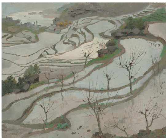
水田（一） 吴冠中