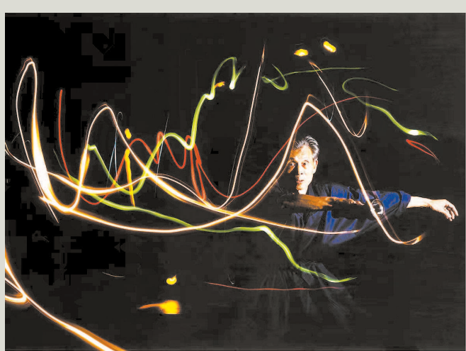
吴冠中与蔡斯民共同创作的“点线无极”系列（1988年，蔡斯民摄于新加坡）