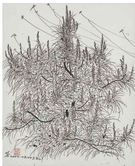
风铃 吴冠中