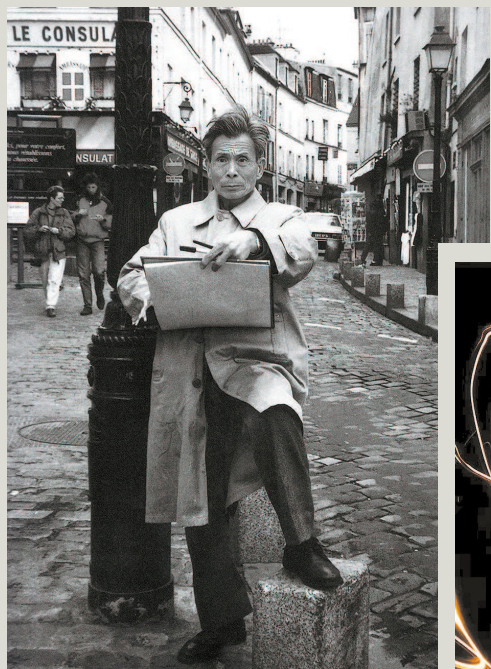
1989年，吴冠中在巴黎写生