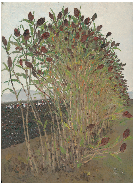
高粱与棉花 吴冠中