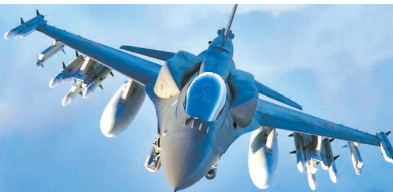
■ F-21战斗机 图 GJ

此外,洛克希德-马丁公司明确提出技术转让,这让印度尤其难以拒绝。 本报记者 王佳焱